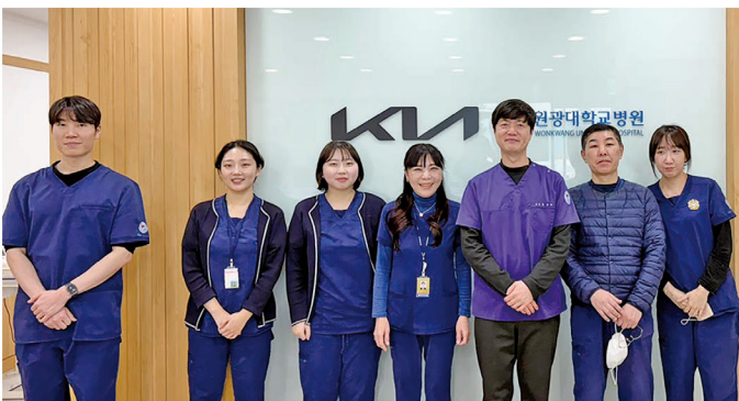
원광대학교병원이 기아자동차 오션뷰 건강관리를 인정받아 향후 3년간의 토랜드 광주의원 2개소를 재위탁·재위탁 계약을 체결하게 되었다.