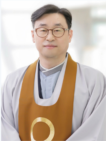
지산 정원도 교무

3월입니다. 새해를 맞이하고 벌써 두어달이 지났습니다. 세월이 빠르다는 사자성어를 살펴보면, 빛 광(光)자와 흐를 류(流)자를 많이 사용합니다. 빛과 물과 같이 몹시 빨리 지나간다는 뜻이겠지요. 시간은 남녀노소를 가릴 것 없이 누구에게나 똑같이 주어집니다. 그렇기 때문에, 오늘 하루를 맞이하는 내 마음가짐을 어떻게 하고 있는지 깊이 살펴 봐야 됩니다.