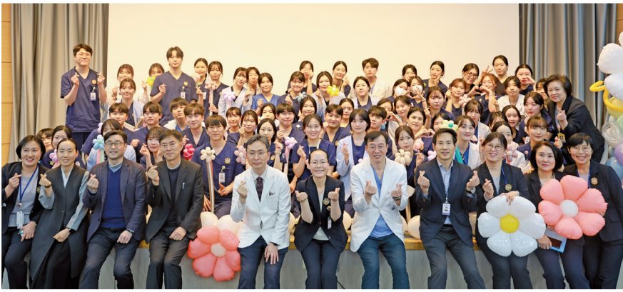
원광대학교병원이 지난 14일 외래 1관 4층 대강당에서 입사 1주년 기념하는 '2024년 신규간호사 복돋우기 행사'를 개최했다.

원광대학교병원 간호부는 신규간호사들에게 직업에 대한 긍지와 환자 중심 마인드를 함양하고, 지난 1년간 임상 현장을 함께 한 신규간호사들의 노고를 격려하고 축하하며 앞으로의 성장을 응원하기 위해 이 행사를 마련했다고 전했다.