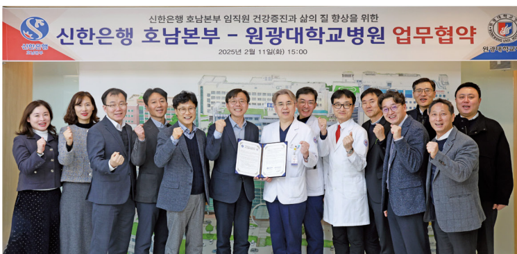
원광대학교병원이 지난 11일 신한은행 호남본부와 업무협약을 체결했으며, 양 기관의 주요 관계자들이 참석한 가운데 상호 협력 의지를 다